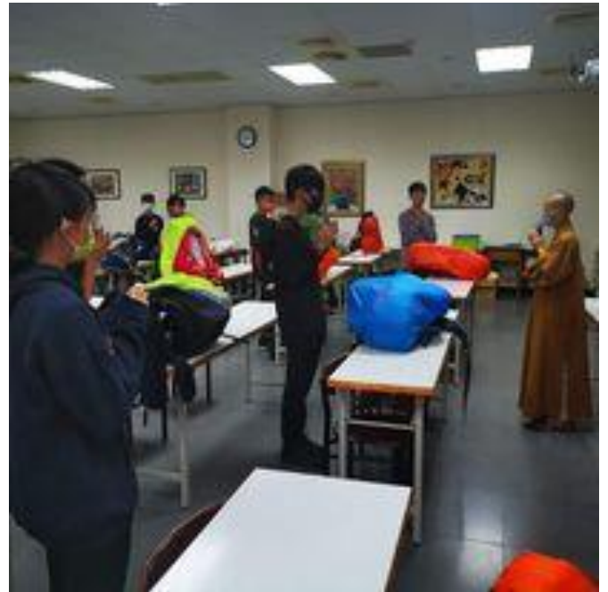
整理裝備~祈福行前叮嚀~準備出發