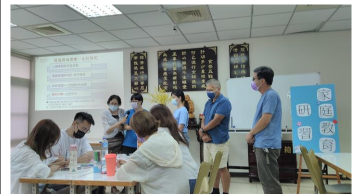
分組上台演練分享 與家長的良性溝通